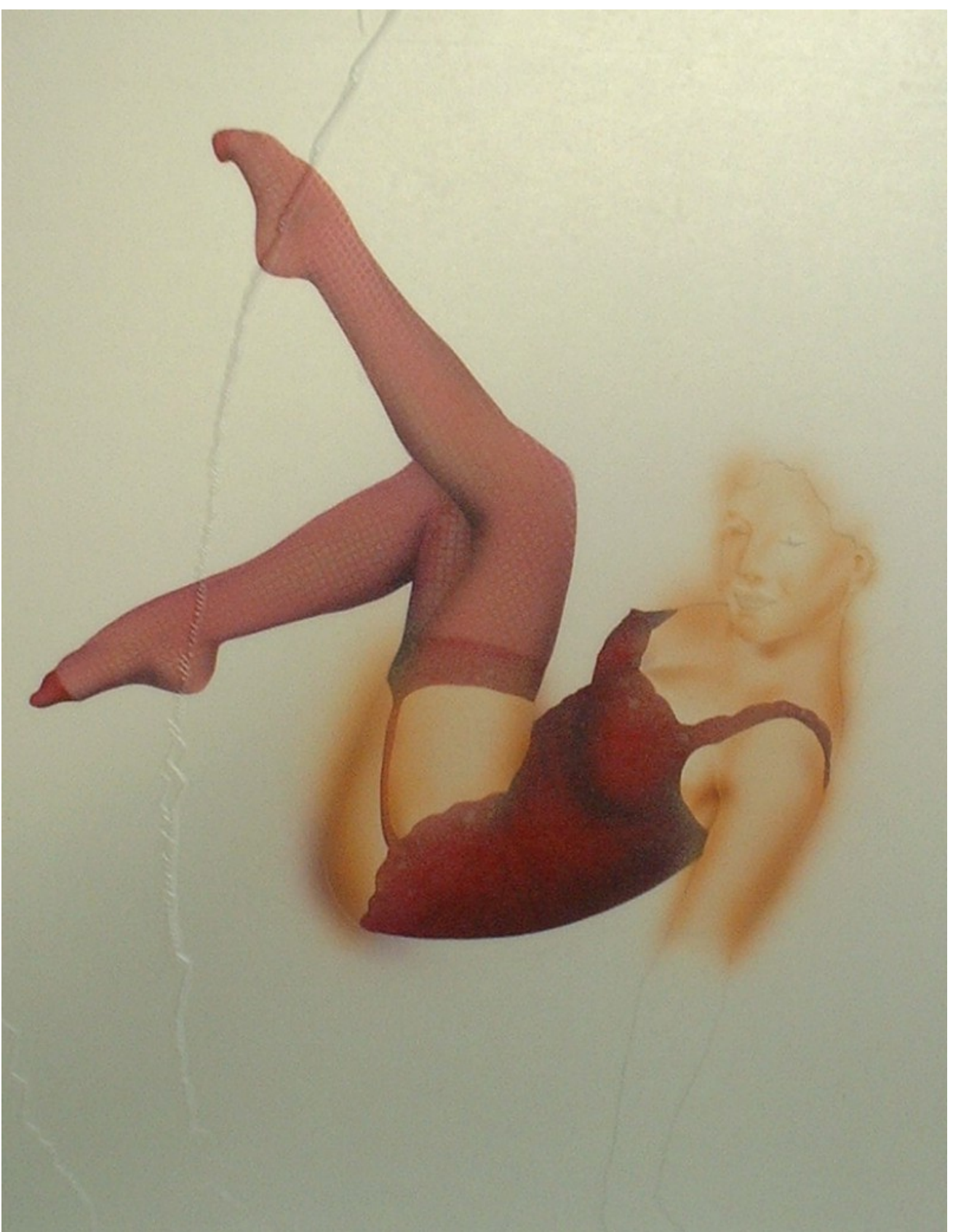
Utilizamos plantillas para los ojos y labios, y le comenzamos a agregar el maquillaje.