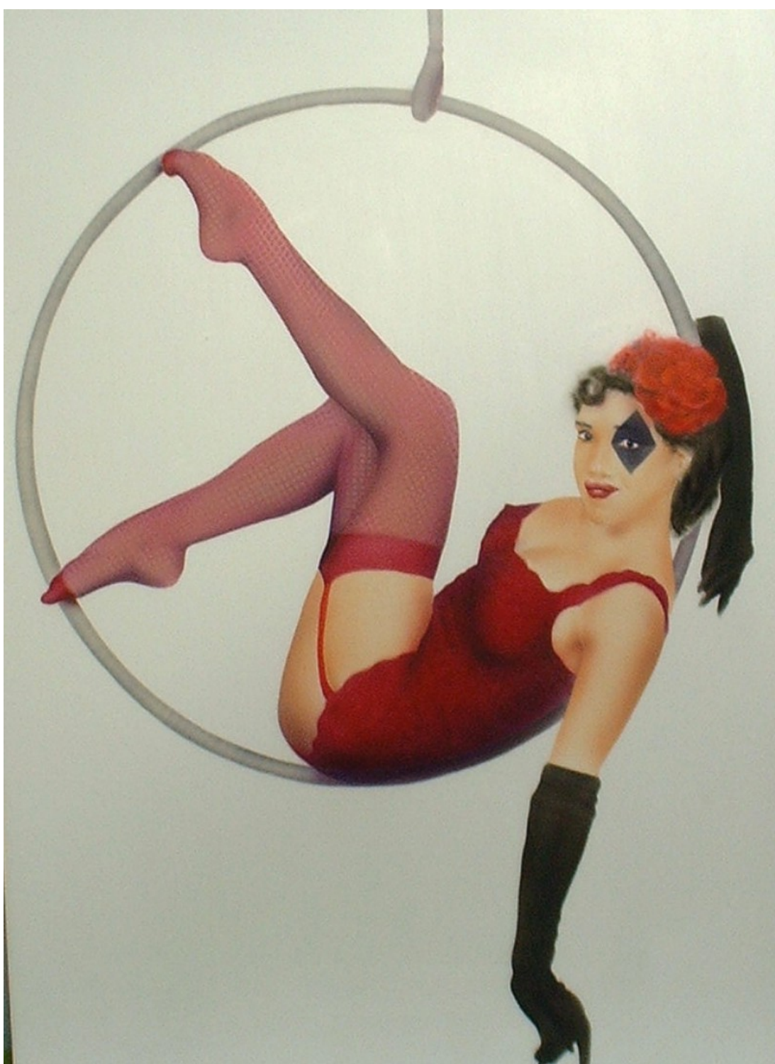
Lo unico que queda pendiente es la red del sombrero y algunas sombras