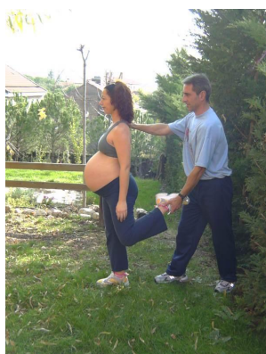
Fig. 2: Trabajos con la ayuda de un compañero (Barakat, 2006).

Por otra parte, presenta ciertas ventajas para la mujer gestante que por ciertas cuestiones de vida diaria no pueda asistir a alguna clase. En ese caso, ésta (la clase) puede ser desarrollada de forma autónoma en la propia casa, o con la ayuda de un/a compañero/a.