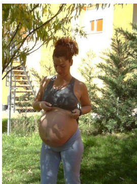
Fig. 3: La utilización de un pulsómetro es, sin dudas, la mejor opción para el control de la frecuencia cardíaca. (Barakat, 2006).

La mejor manera de controlar la frecuencia cardíaca es, sin lugar a dudas mediante la utilización de un pulsómetro (Fig. 3).