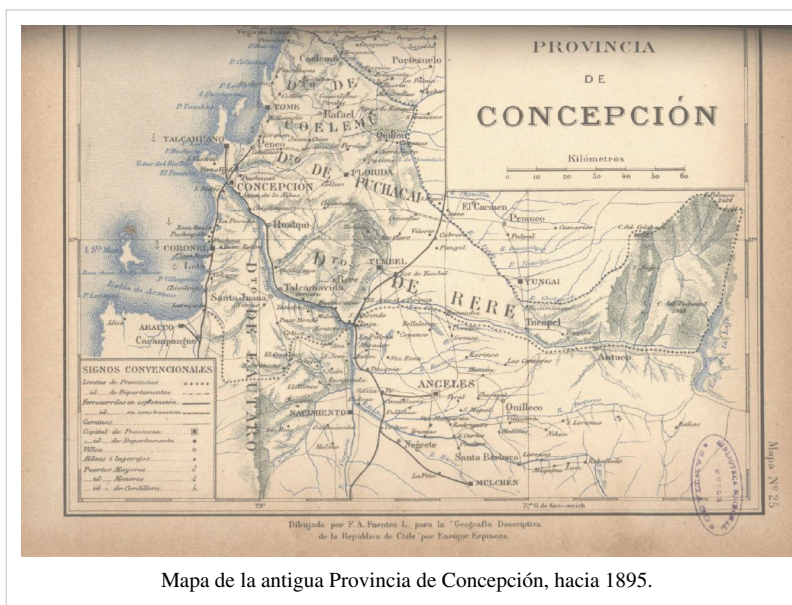
Mapa de la antigua Provincia de Concepción, hacia 1895.

Véanse también: Antigua provincia de Concepción (Chile) y Región del Biobío